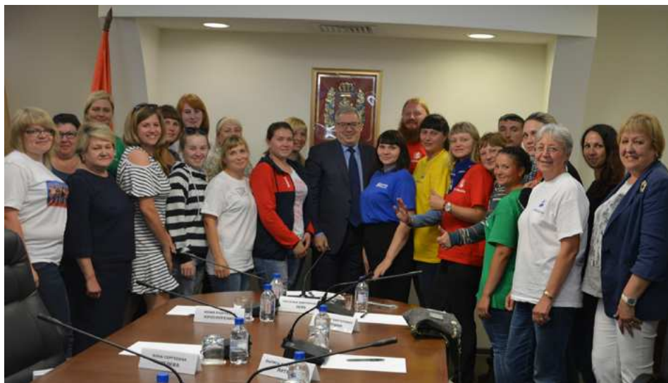
Встреча с Губернатором края Виктором Толоконским

Красноярская краевая организация Профсоюза выражает благодарность министерству образования Красноярского края, а также краевому центру туризма и краеведения за помощь в организации и проведении мероприятия.