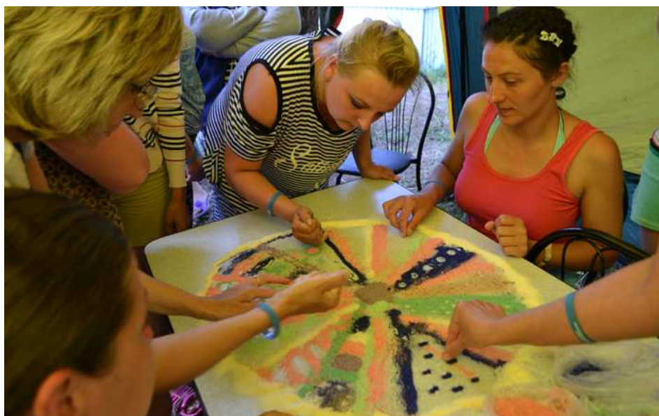
Мастер-класс «Мандала-терапия» на Тепсее

Красноярского края «Тепсей». Фестивальная поляна объединила талантливых, творческих и активных людей. Всего, в мероприятии приняли участие почти 300 работников образования с разных муниципальных образований нашего края. Проект осуществляется краевым Домом работников просвещения, при поддержке министерства образования Красноярского края и Красноярской территориальной (краевой) организации Профсоюза работников народного образования