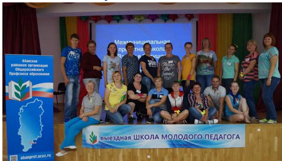
Участники проектной школы "Взгляд в будущее"

С 1 по 4 июля 2017 года в Минусинском районе на территории Потрошиловского бора, напротив горы Тепсей, в девятый раз прошел Открытый краевой фестиваль творческих и общественных объединений работников образования