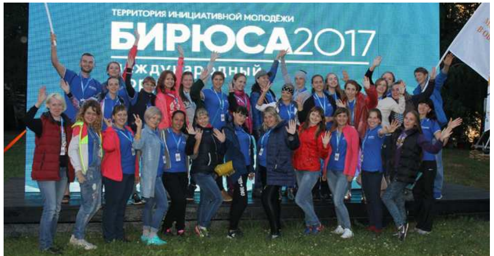
Молодые педагоги на ТИМ "Бирюса"

С 8 по 14 июля проходила первая смена международного форума территория инициативной молодежи «Бирюса - 2017», «Молодые профессионалы». Смена объединила на одной площадке более 800 молодых специалистов различных сфер из 23 регионов России и 4 зарубежных стран. В одной из дружин были собраны молодые педагоги со всего Красноярского края. Смена была направлена на содействие формированию единого пространства для развития профессиональных сообществ, организацию взаимодействия потенциального работодателя и работника. Помимо участия в традиционных «бирюсинских» мероприятиях перед педагогами стояла задача подготовки проектов для защиты на краевом августовском педагогическом совете. Напомним, что проекты, прошедшие общественно-профессиональную экспертизу, получают грантовую поддержку от министерства образования края до 500 000 рублей.