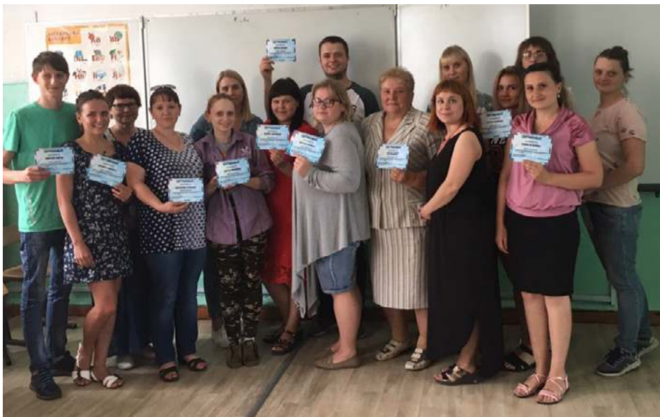
Участники проектной школы

С 10 по 13 июня на территории Уярского района проходила проектная школа для молодых специалистов в рамках реализации проекта «Сегодня - молодой специалист, завтра - наставник».