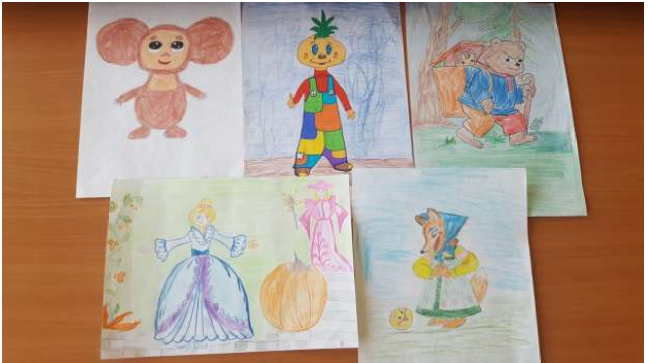
Рисование «МОЯ ЛЮБИМАЯ СКАЗКА»