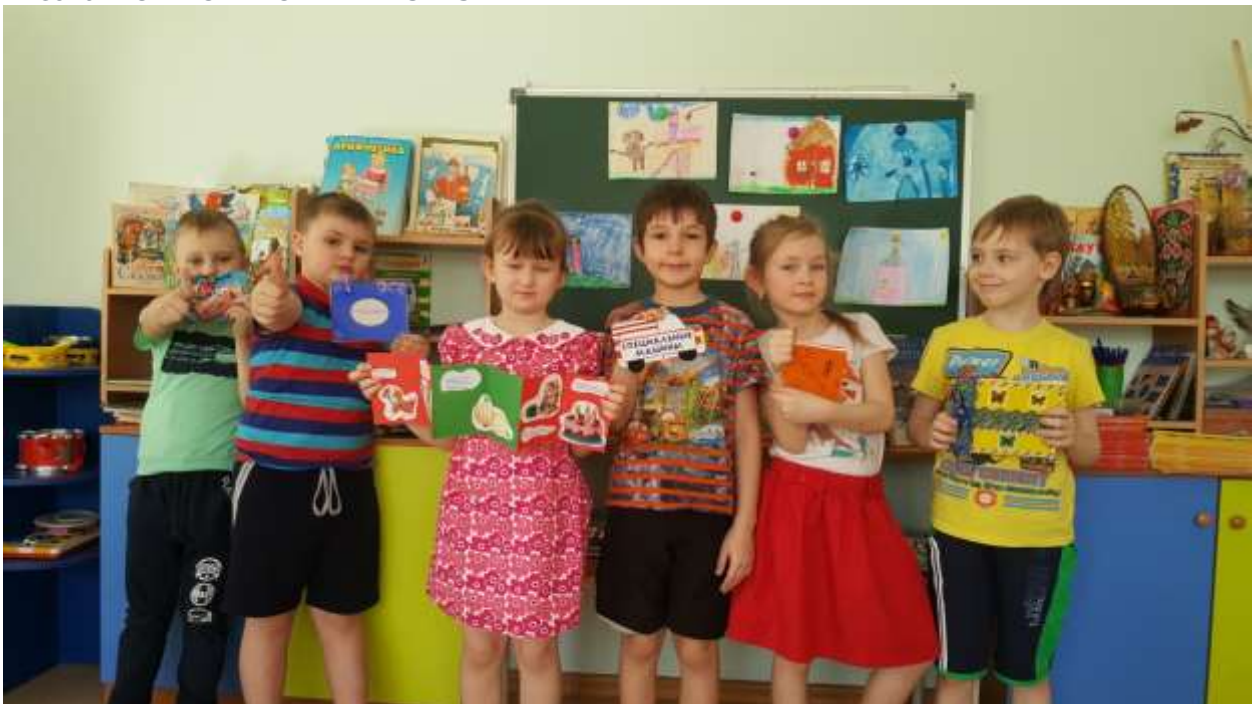
Презентация детьми своих книжек-малышек