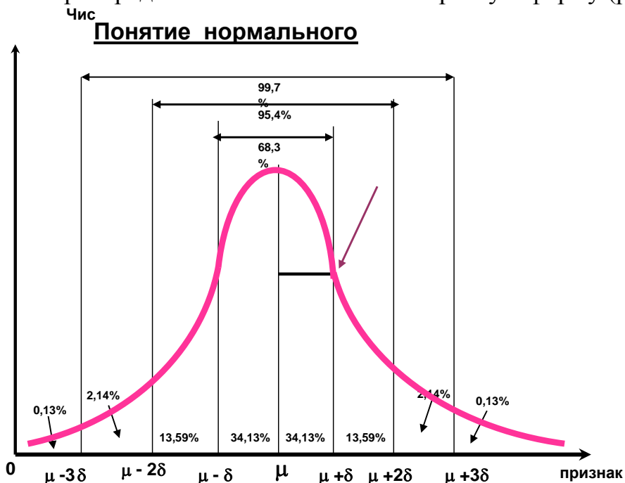
Рис. Кривая нормального распределения К.Гаусса

Нормальное распределение имеет колоколообразную форму (рис. 1).