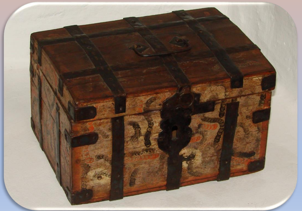
Сундук для хранения денег