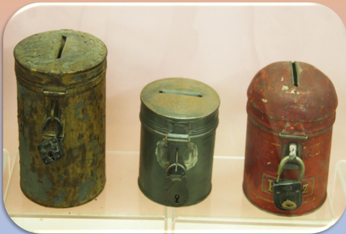
Копилка с замками для денег