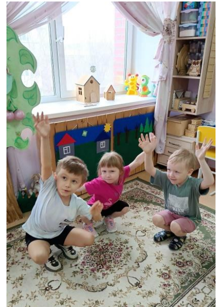
б) Знакомство с вопросительной интонацией, средствами ее выражения и способами обозначения