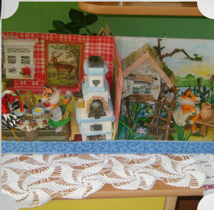
Макет к сказке «Журавль и лисица» в обр. Толстого Л.Н