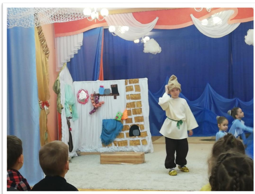
Фото 4. Детский спектакль «Сказка о рыбаке и рыбке»