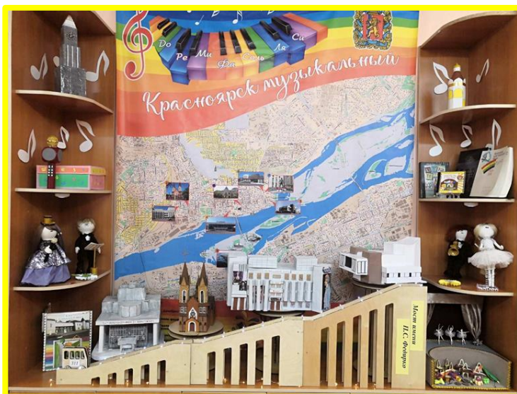
Тема периода: «К нам Весна шагает», «Красноярск душа и сила Сибири»