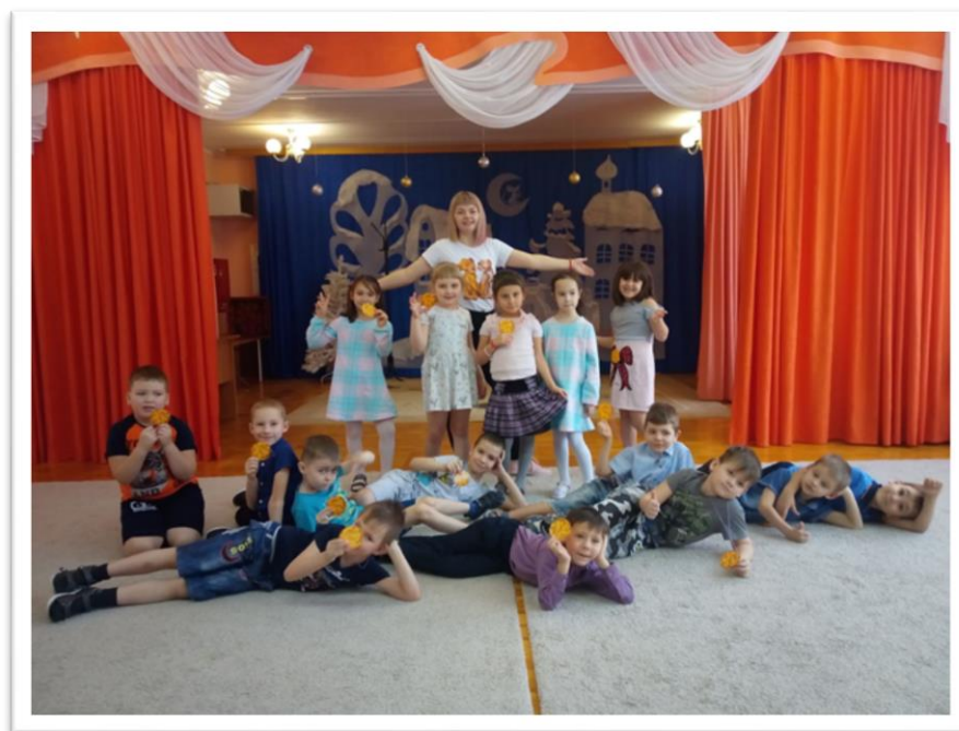
Фото 3. Открытое занятие «Поделись улыбкой своей»