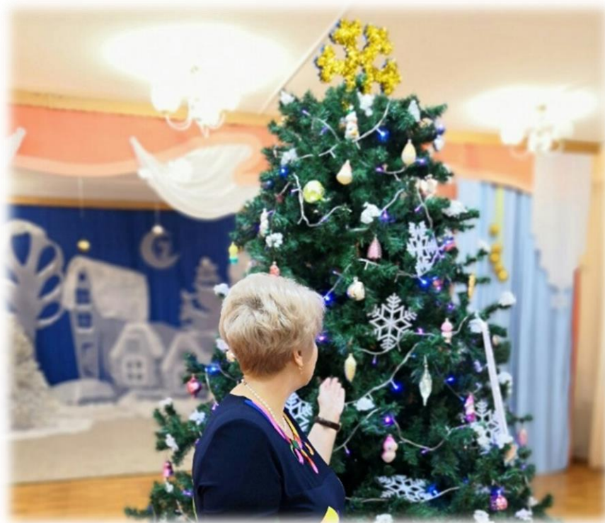
Праздник «Выпуск в школу»