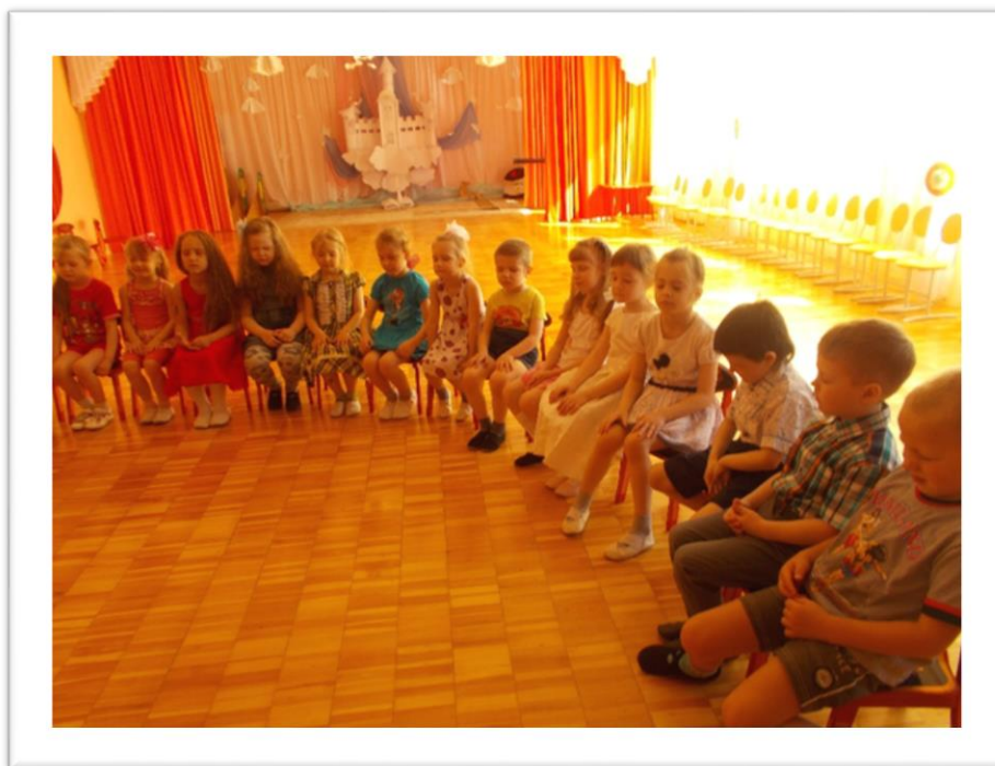
Фото 7. Слушание музыки

Оборудованы стеллажи, обеспечивающие доступность ребенку в выборе игрового оборудования.