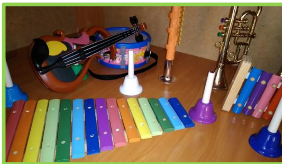
Инструменты симфонического оркестра