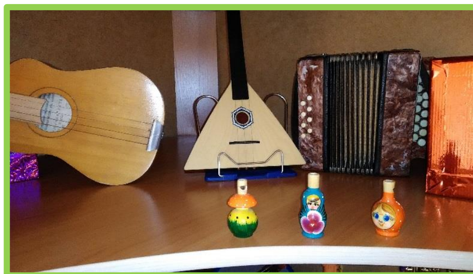
Русские народные инструменты