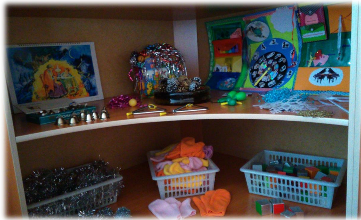
Тема периода: «За окном живет зима» и «Ой, зима, игра да забавы»