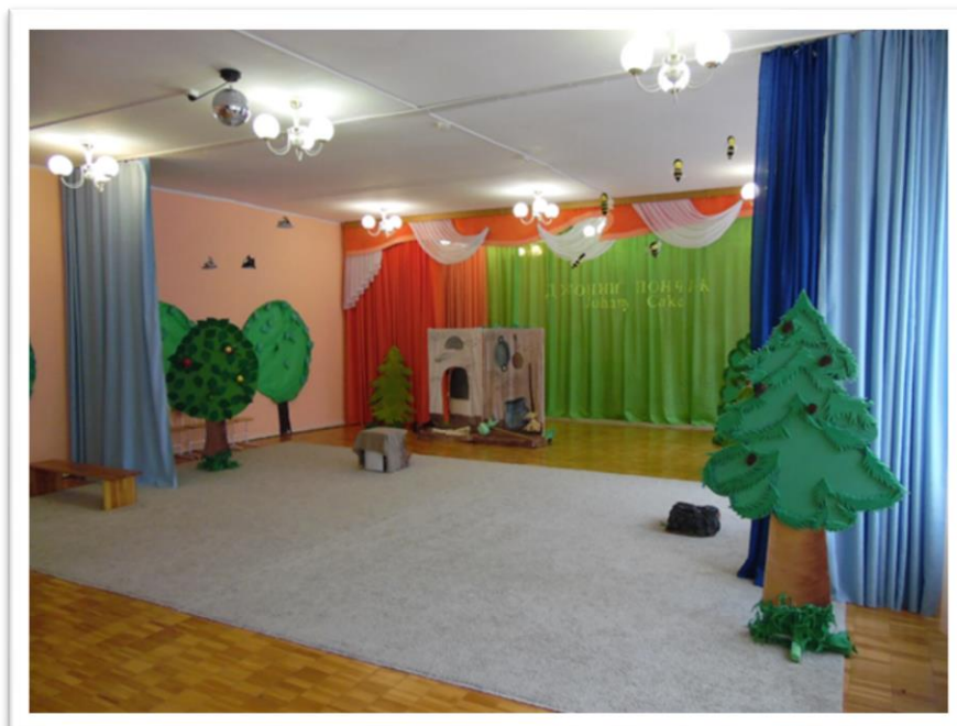
фото2.Детский спектакль«Джонни пончик»