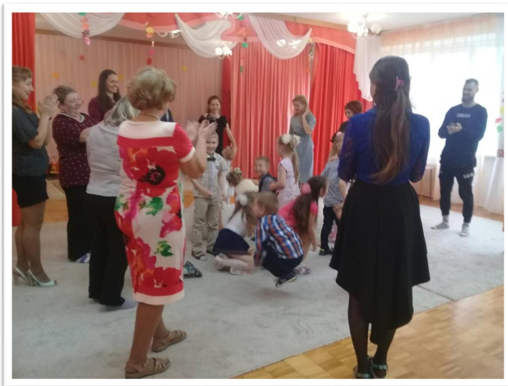
Фото 5. «Развлечение с мамами и папами»

Спокойная зона - самая важная , здесь осуществляется восприятие музыки и пение. Соблюдается важнейший принцип взаимодействия детей с педагогом - «глаза в глаза».