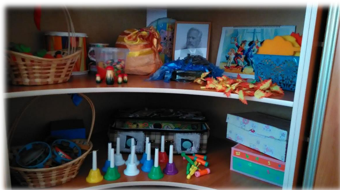
Тема периода: «Собираем урожай в поле, саду и огороде»