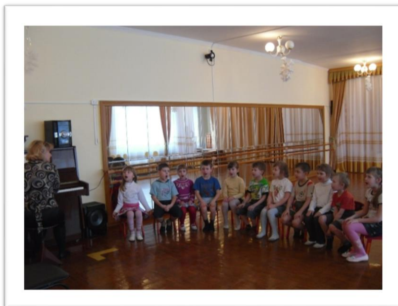
Фото 6. Пение

Спокойная зона - самая важная , здесь осуществляется восприятие музыки и пение. Соблюдается важнейший принцип взаимодействия детей с педагогом - «глаза в глаза».