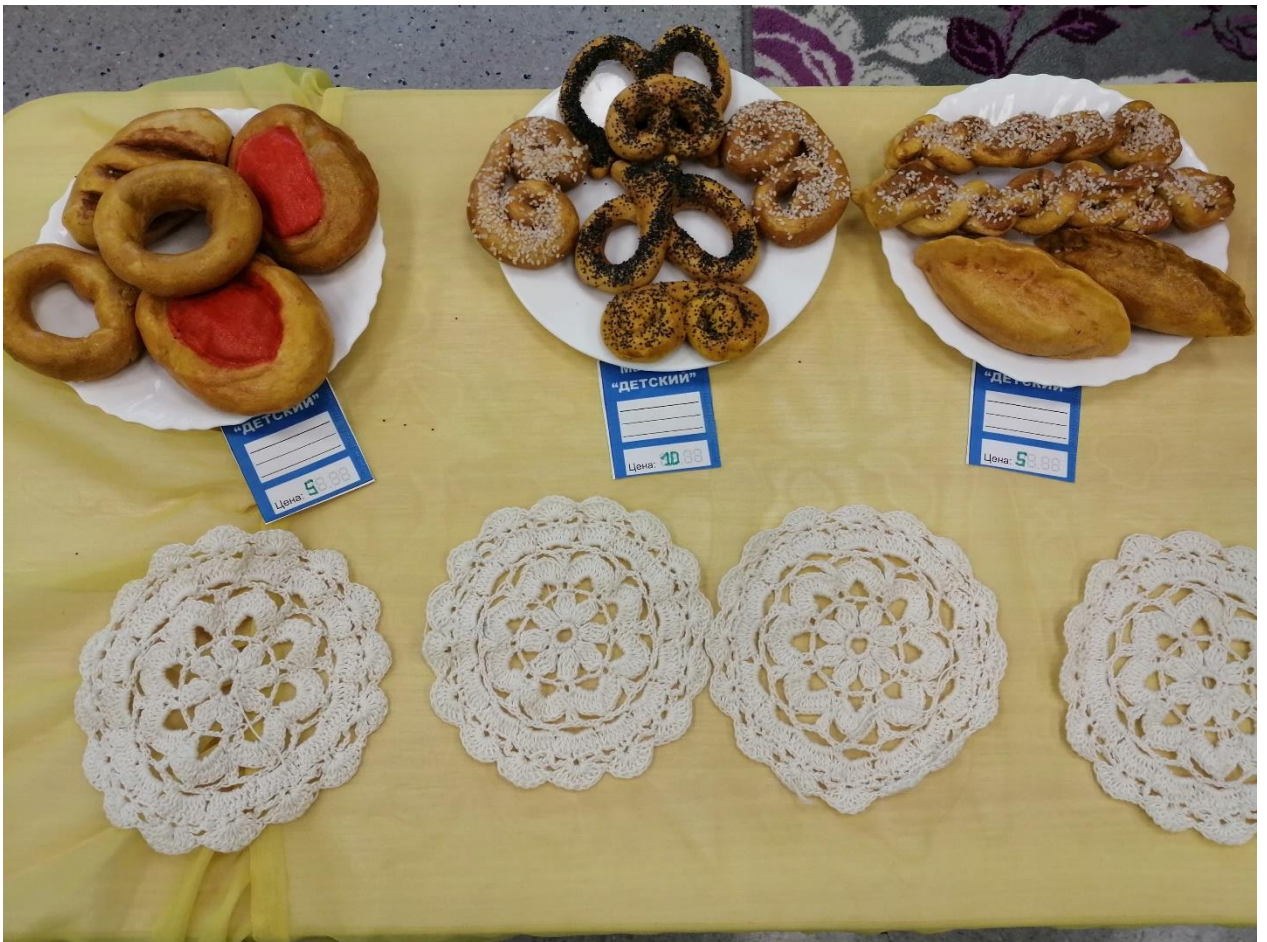
Изделия из соленого теста.