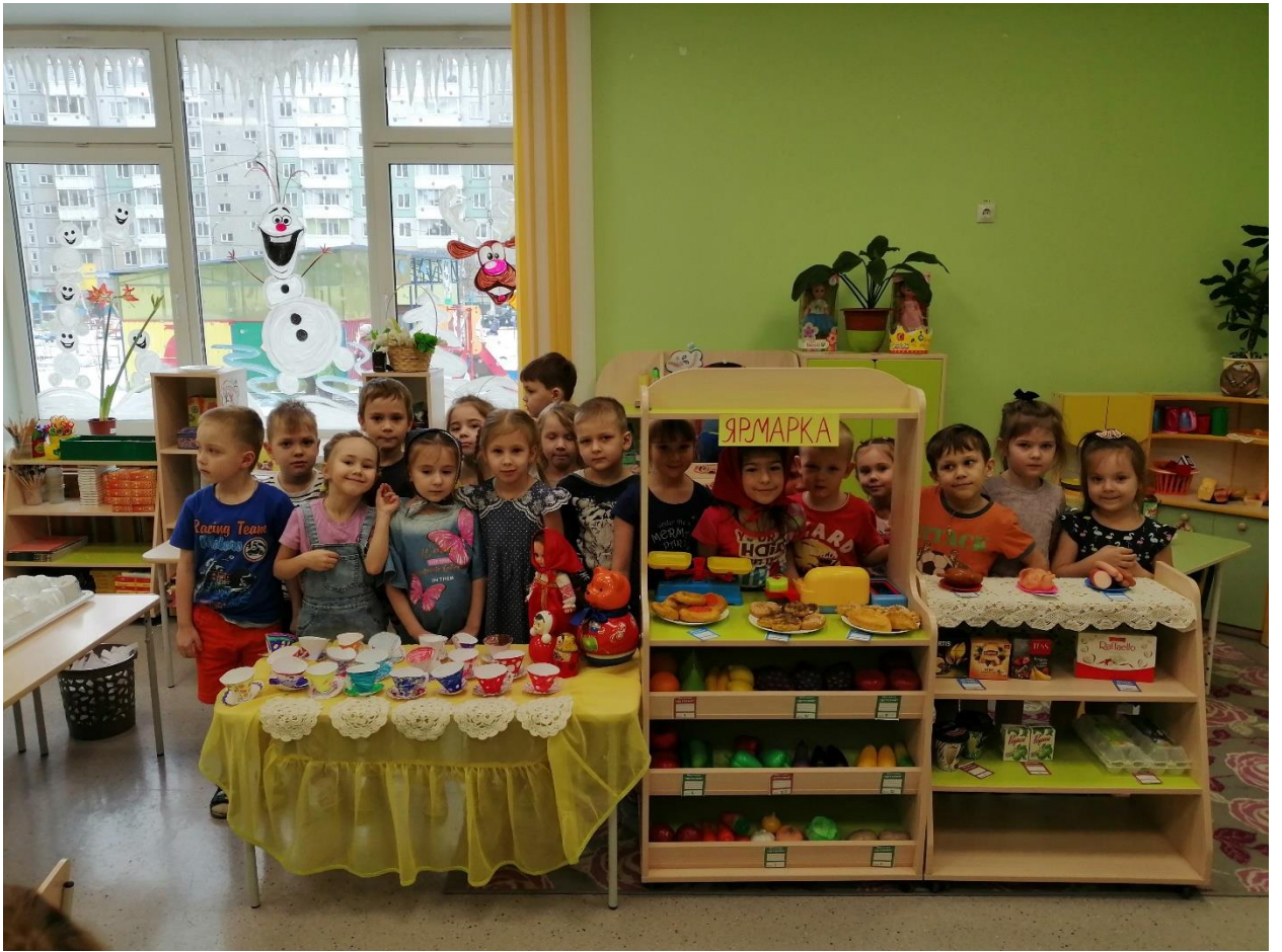
А далее самостоятельная игровая деятельность детей.