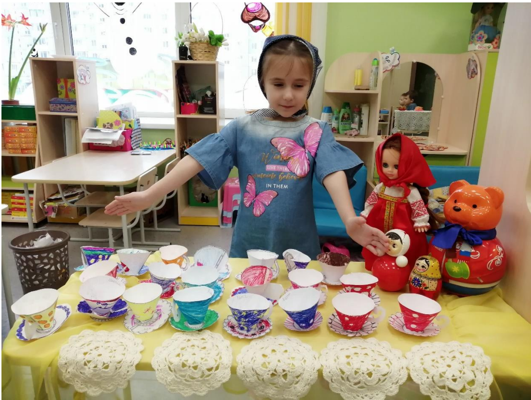
Превращаем «ПРОДУКТ» в «ТОВАР»