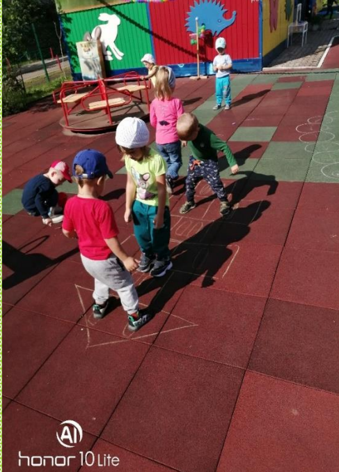
AI honor 10 Lite