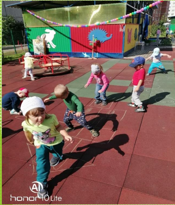
AI honor 10 Lite