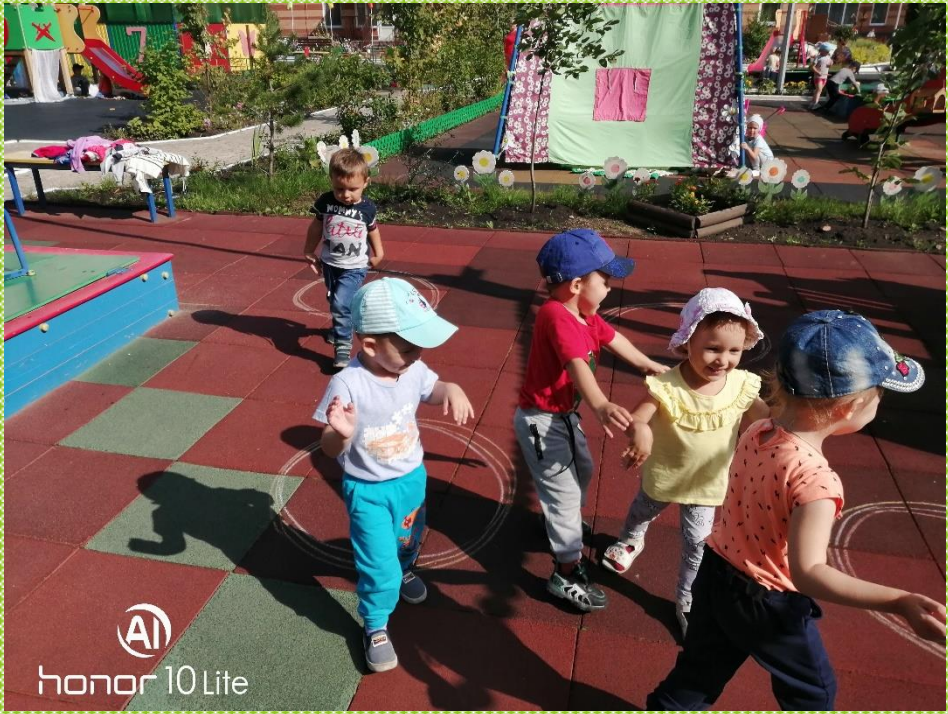
AI honor 10 Lite