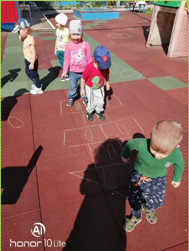
AI honor 10 Lite