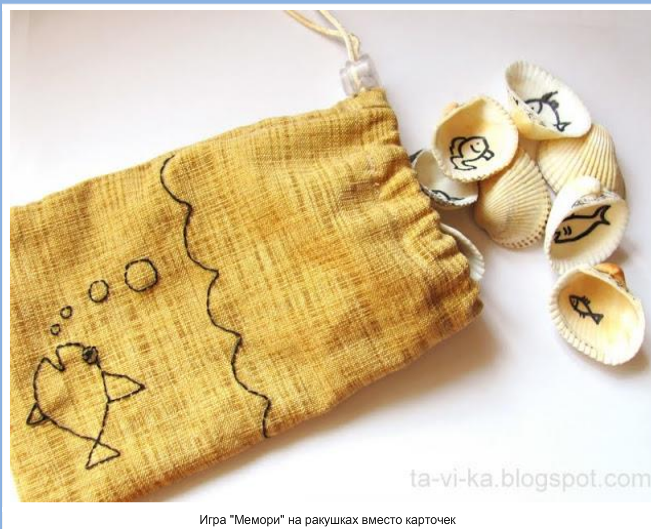
Игра "Мемори" на ракушках вместо карточек

Ракушки, которым мы привезли с моря, служат не только материалом для поделок. Из них можно легко и просто своими руками сделать детскую развивающую игру "Мемори" или как ее у нас называют "Парочки" .