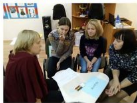
Тренинг «Эффективное взаимодействие педагогов с родителями» в г.Сосновоборске

Продолжили эстафету молодые педагоги г. Сосновоборска. В тренинге «Эффективное взаимодействие педагогов с родителями», прошедшем 18 октября на базе Детского сада