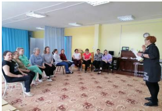
Семинары с педагогами в ДОО