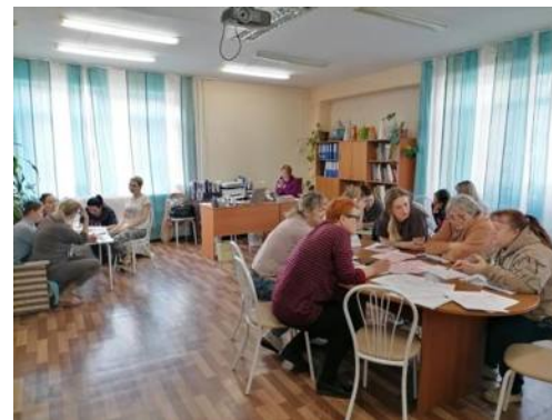
Круглые столы с педагогами и родителями