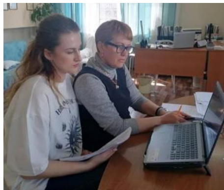
Трансляция опыта педагогам города