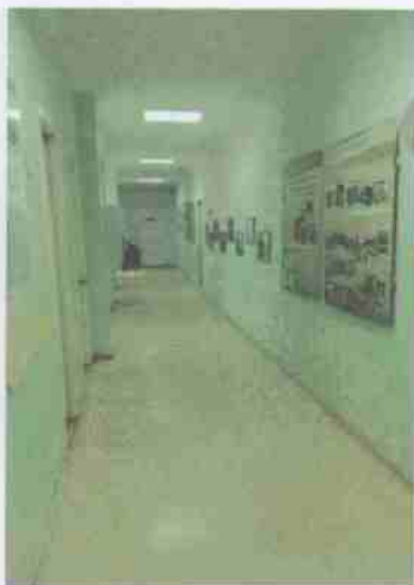
Φοτο Νο 6