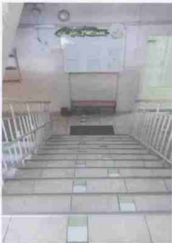
Фото № 8