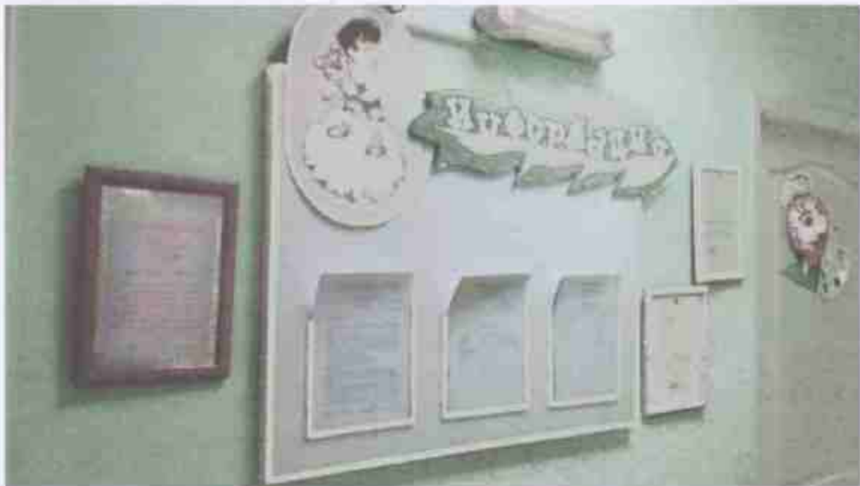
Фото № 15

Система информации на объекте признана временно недоступной всем. Организация размещения комплексной системы информации на всех зонах объекта сделает доступной условно всем остальным категориям инвалидов и МГН.