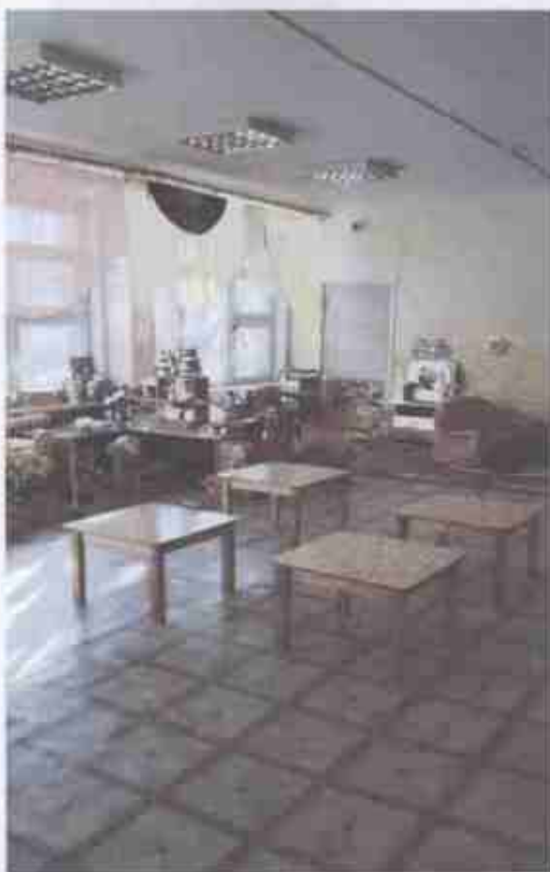
Фото № 9

Зона целевого назначения здания (целевого посещения объекта) признана доступной частично избирательно (У). Размещение информации о помещении на стене со стороны дверной ручки на высоте от 1,4 до 1,75 м с дублированием рельефным шрифтом, нанесение контрастной и рельефной поверхности за 0,6м перед дверью, выделение в зале не менее 5% специально оборудованных мест с возможностью усиления звука и дублированием звуковой и визуальной информации (организация сурдоперевода), организация ситуационной помощи в виде сопровождения персонала позволит сделать зону целевого назначения здания доступной условно всем остальным категориям инвалидов и МГН