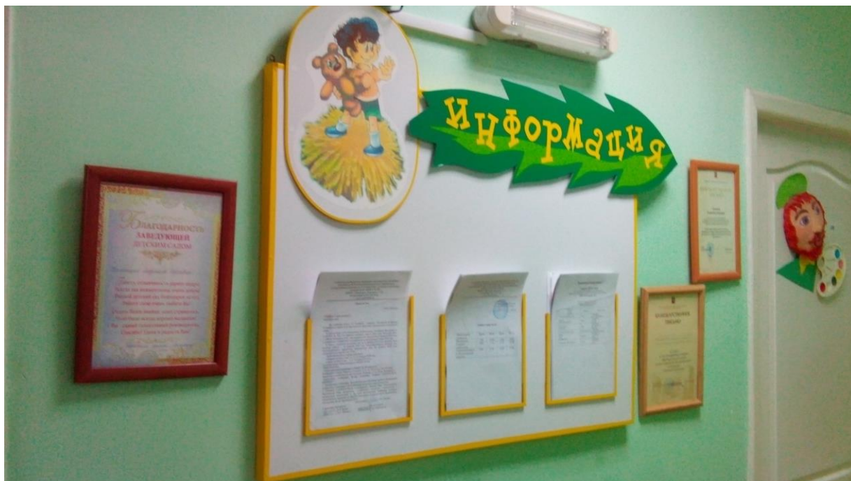
Фото № 15

Система информации на объекте признана временно недоступной всем. Организация размещения комплексной системы информации на всех зонах объекта сделает доступной условно всем остальным категориям инвалидов и МГН.