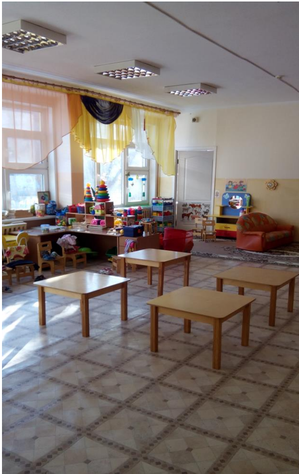
Фото № 9

Зона целевого назначения здания (целевого посещения объекта) признана доступной частично избирательно (У). Размещение информации о помещении на стене со стороны дверной ручки на высоте от 1,4 до 1,75 м с дублированием рельефным шрифтом, нанесение контрастной и рельефной поверхности за 0,6м перед дверью, выделение в зале не менее 5% специально оборудованных мест с возможностью усиления звука и дублированием звуковой и визуальной информации (организация сурдоперевода), организация ситуационной помощи в виде сопровождения персонала позволит сделать зону целевого назначения здания доступной условно всем остальным категориям инвалидов и МГН