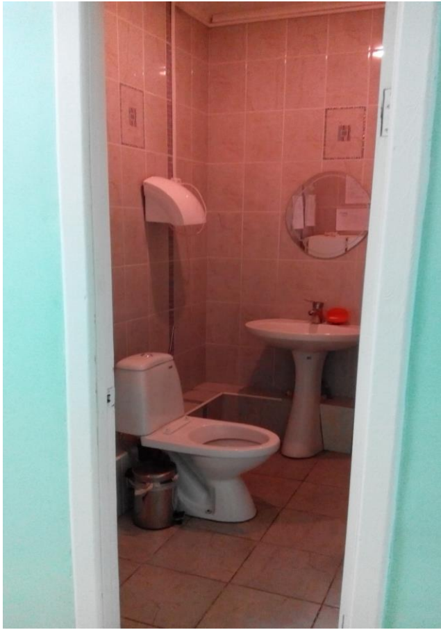
Φοτο Νο 13