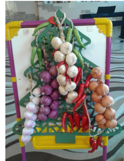
ЛЭПБУК «Где живут витамины?»