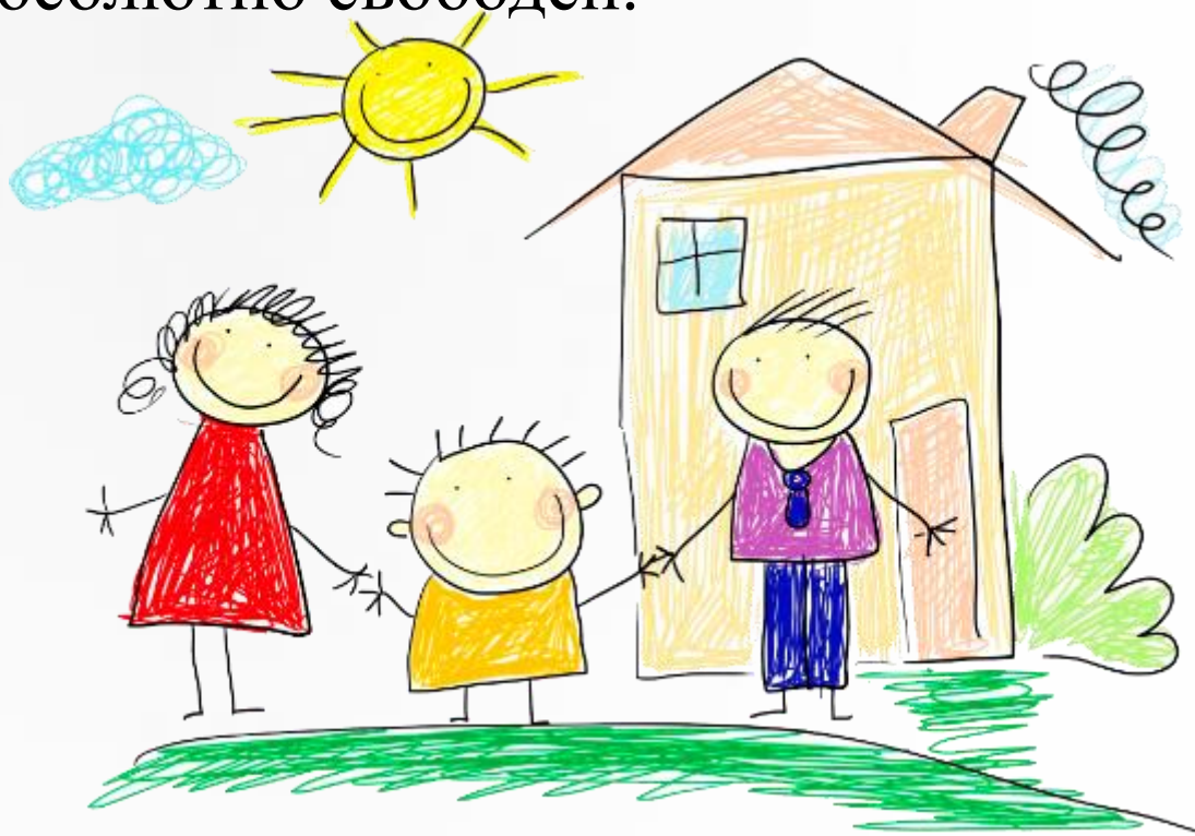
Рисунок для ребенка является не искусством, а речью. Рисование дает возможность выразить то, что в силу возрастных ограничений он не может выразить словами. В процессе рисования рациональное уходит на второй план, отступают запреты и ограничения. В этот момент ребенок абсолютно свободен.

Детский рисунок чаще всего наглядно демонстрирует сферу интересов самого маленького художника. Мы как родители и педагоги можем много нового узнать о своих детях, если понаблюдаем за ними во время рисования.