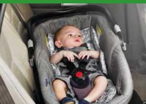
Автокресло «люлька» группы 0 (для детей массой < 10 кг)*

При покупке детского удерживающего устройства обязательно следует уточнить у продавца наличие сертификата на товар!