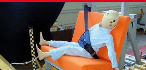
Результаты тестов использования небезопасных удерживающих устройств*

Дополнение определения «направляющая ляжка» в Правилах ЕЭК ООН № 44-04 было одобрено Всемирным Форумом (WP.29). Внесенная поправка к формулировке указывает на то, что «направляющая ляжка» рассматривается как составной элемент детской удерживающей системы и НЕ может отдельно официально утверждаться в качестве детской удерживающей системы в соответствии с настоящими Правилами». Это исключает даже формальную возможность сертификации устройств типа «направляющая ляжка»!