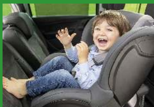
Автокресла групп I (для детей массой 9-18 кг)*